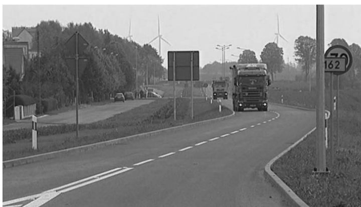
Ryc. 3. Obwodnica Gościna uruchomiona w 2014 roku

Zgodnie z rozporządzeniem Rady Ministrów z dnia 27 lipca 2010 roku Gościno uzyskało status miasta 1 stycznia 2011 roku. W dotychczasowej historii Gościna jako miasta dokonano rozbudowy centrum rekreacyjno-sportowego z zapleczem hotelowym, wybudowano lodowisko, fit park oraz amfiteatr. Zmiany te przyczyniły się z kolei do wzrostu liczby wydarzeń kulturalnych oraz imprez w mieście. Uruchomione zostało także targowisko stałe, supermarket, miała miejsce dalsza przebudowa dróg w mieście oraz budowa ścieżek rowerowych. Podjęte zostały kroki w sprawie budowy obwodnicy Gościna, w celu wyprowadzenia uciążliwego ruchu na obrzeża oraz urbanizacji terenów zachodnich nowo powstałego miasta. Dążenia te zostały uwieńczone sukcesem w 2014 roku, kiedy oddano do użytku odcinek o długości blisko 3 km. Przy nowej obwodnicy (ryc. 3) powstała także stacja paliw (niestety wskutek osiadania gruntu już w roku następnym droga stała się nieprzejezdna i wymagała remontu). Zmiany administracyjne skutkowały też utworzeniem straży miejskiej.