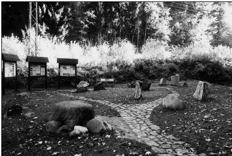
Ryc. 7. Ogródek geologiczny przed jaskinią Na Pomezi

W wielu miejscach Moraw i Śląska można spotkać ogródki geologiczne, w których są prezentowane zróżnicowane geologicznie bloki skalne. Najczęściej formacje te nawiązują do miejscowej budowy geologicznej. Przykładem jest ogródek geologiczny z eksponowanymi 72 głazami narzutowymi w miejscowości Velká Kraš w Jesionikach. Natomiast przy jaskiniach Na Pomezi (ryc. 7) oraz Katarzyńska (ryc. 8) zaprezentowano fragmenty skał, nawiązując tym samym do budowy geologicznej obszaru ich występowania.