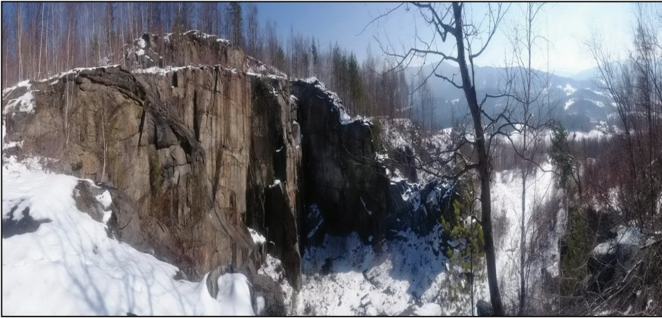
Ryc. 5. Kamieniołom Boží hora w miejscowości Žulová