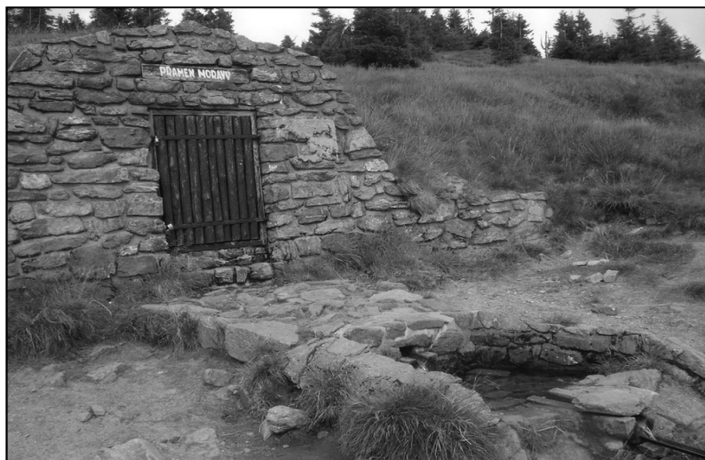
Ryc. 9. Źródła Morawy na południowym stoku Śnieżnika

Moraw płynie w kierunku północnym. Głównymi jej dopływami na Morawach i Śląsku są: Opawa, Ostrawica i Olza. Całkowita długość Odry wynosi 861 km, z czego w granicach państwa czeskiego płynie na odcinku 126 km. Uchodzi do Zalewu Szczecińskiego.