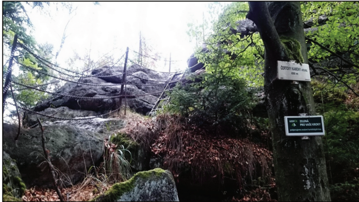
Ryc. 4. Čertovy kameny Fig. 4. Devil's Stones

Nie sposób wymienić wszystkich takich miejsc. Najciekawsze, zdaniem autorów, zaprezentowano w tabeli 3.