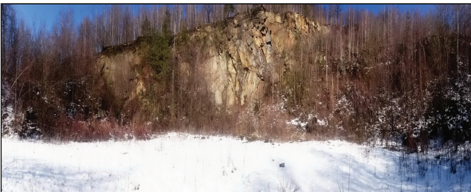
Ryc. 6. Kamieniołom Kani hora w miejscowości Skorošice (fot. A. Marek)

W kamieniołomie Brodka odsłaniają się kopalne formy krasowe powstałe w ciepłym klimacie w okresie trzeciorzędu. Tworzą one podziemne pionowe zagłębienia o głębokości kilkunastu metrów powstałe w wapieniach, dolomitach i gipsach, wypełnione w późniejszym okresie materiałem gliniasto-piaszczystym. Formy te powstają w wyniku sączenia się w głąb, wzdłuż szczelin, wód o dużej zawartości dwutlenku węgla. Tego typu formy określane są jako „kras rurowy” (Otawa, Ponury 2007).