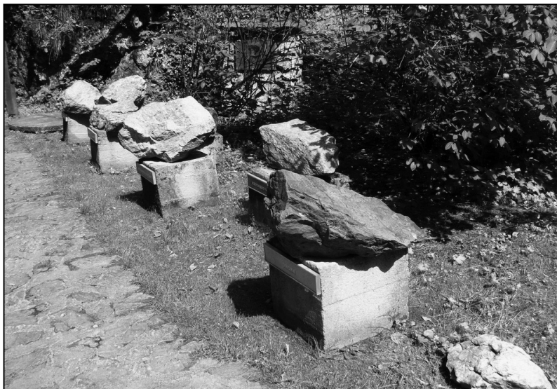
Ryc. 8. Ogródek geologiczny przed Jaskinią Katarzyńską