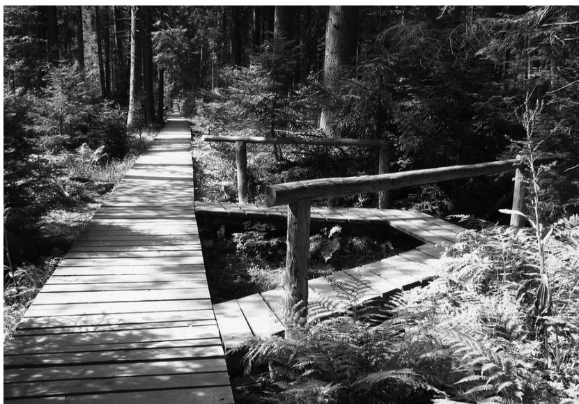
Ryc. 10. Ścieżka turystyczna w Rejvíz

Do torfowisk o znaczeniu regionalnym należy zaliczyć Rejvíz, położone w Jesionikach (ryc. 10). Torfowisko Rejvíz jest położone w północnej części Wysokiego Jesenika na wysokości 734-794 m n.p.m. Większość torfowiska odwadnia Czarna Opawa w kierunku wschodnim, zaś od zachodu niewielki fragment Vrchovištni potok. Na torfowisku znajdują się dwa jeziora: Wielkie i Małe Jezioro Torfowe. Wiek torfowiska szacowany jest na 6-7 tys. lat. Wśród gatunków licznie występujących na omawianym terenie należy wymienić: sosnę błotną ( Pinus uncinata subsp. Uliginosa ), bagno zwyczajne ( Ledum palustre ), rosiczkę okrągłolistną ( Drosera rotundifolia ), tojeść bukietową ( Lysimachia thyrsoiflora ), bagnicę torfową ( Scheuchzeria palustris ), wełniankę pochwowatą ( Eriophorum vaginatum ) oraz różne gatunki torfowców, jak np.: torfowiec magellański ( Sphagnum magellanicum ), torfowiec brodawkowaty ( Sphagnum papillosum ), torfowiec kończysty ( Sphagnum recurvum ) (Dudová, Hájek, Hájková 2010).