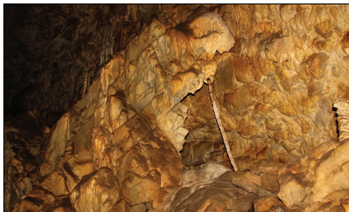
Ryc. 2. Forma naciekowa „Čarodějnice” w Jaskini Katarzyńskiej Fig. 2. The form of stalks “Čarodějnice” in the Catherine’s Cave

Kolejną, równie popularną wśród zwiedzających, jest jaskinia Katarzyńska (Kateřinská jeskyně). Została ona odkryta w 1909 r., a już rok później udostępniono ją do zwiedzania. Ta stosunkowo krótka jaskinia posiada bogatą szatę naciekową (ryc. 2). Szczególną atrakcją są tu cienkie stalagmity pałeczkowe osiągające długość kilku metrów. Największa sala tej jaskini ma wymiary 96 x 44 x 20 m i jest jedną z największych tego typu w kraju (Zajiček 2010). Ze względu na bardzo dobrą akustykę wykorzystywana jest ona jako sala koncertowa.